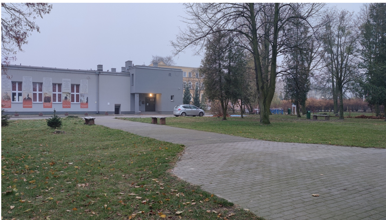
Zdjęcie nr 2. Widok parku od strony Pomnika Poległych i Umęczonych w kierunku budynku Centrum Kultury i Sportu w Jabłonowie Pomorskim