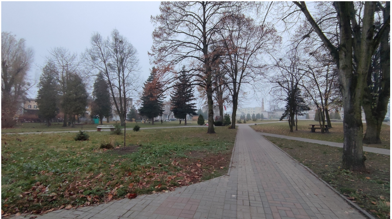
Zdjęcie nr 1. Widok parku od strony Centrum Kultury i Sportu w Jabłonowie Pomorskim

Park nieopodal Centrum Kultury i Sportu przy ulicy Rynek w Jabłonowie Pomorskim, to miejsce nierozzerwalnie od wielu lat kojarzone ze szlachetną inicjatywą Wielkiej Orkiestry Świątecznej Pomocy.