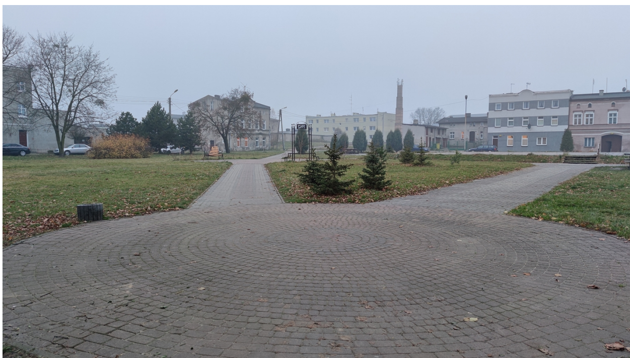
Zdjęcie nr 3. Widok parku zza Pomnika Poległych i Umęczonych w kierunku sklepu przemysłowo-spożywczego „Biedronka”

Wielka Orkiestra Świątecznej Pomocy, jako organizacja pożytku publicznego od blisko 30 lat, wspiera działalność w zakresie ochrony zdrowia, ratowania życia, a także zakupu niezbędnego sprzętu medycznego przekazywanego szpitalom w całej Polsce. Ta pozornie niewinna inicjatywa,